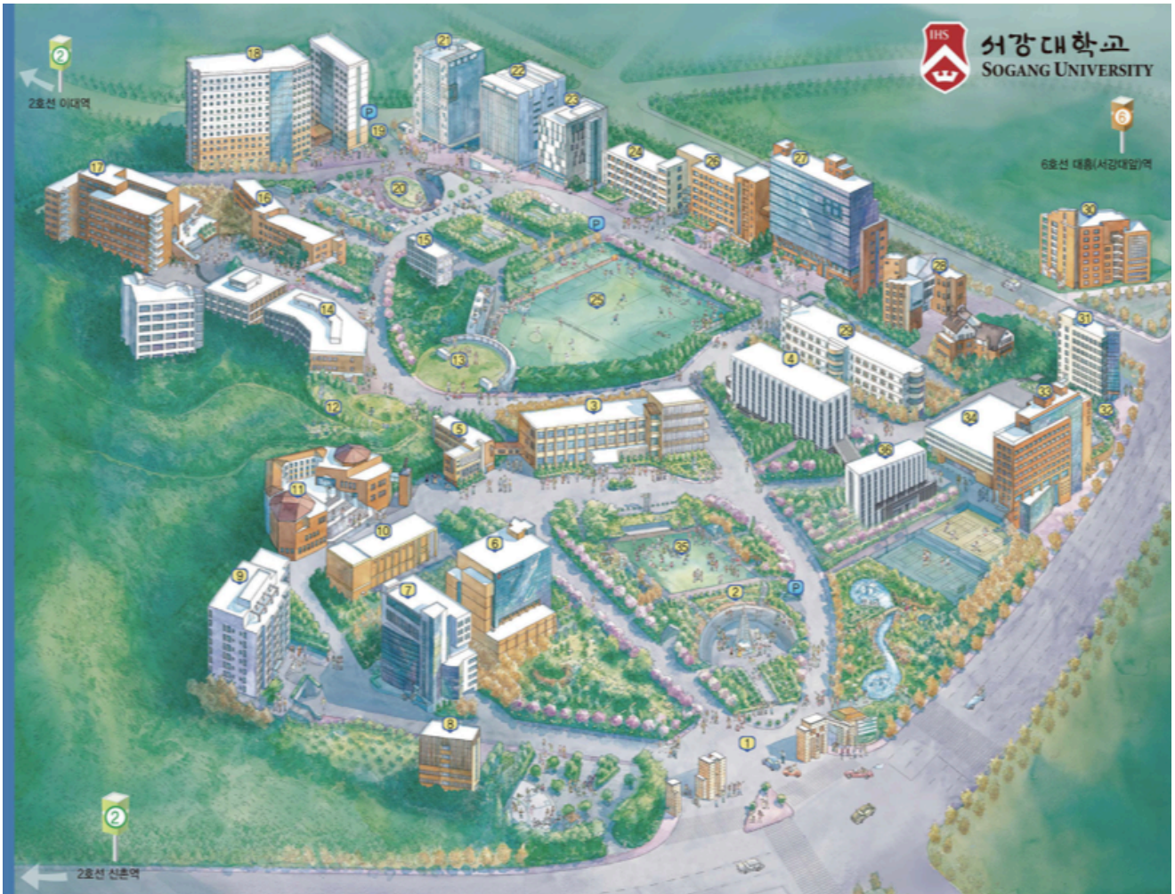
서강대학교 조감도, 마포구, 서울시